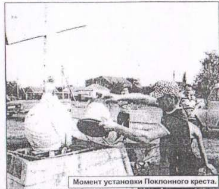
Момент установки Поклонного креста.