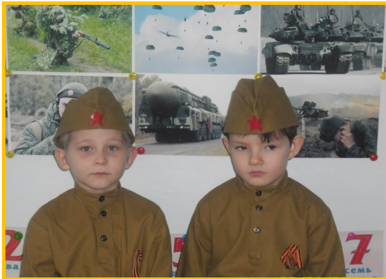
Памятная встреча с ветераном боевых действий в Афганистане